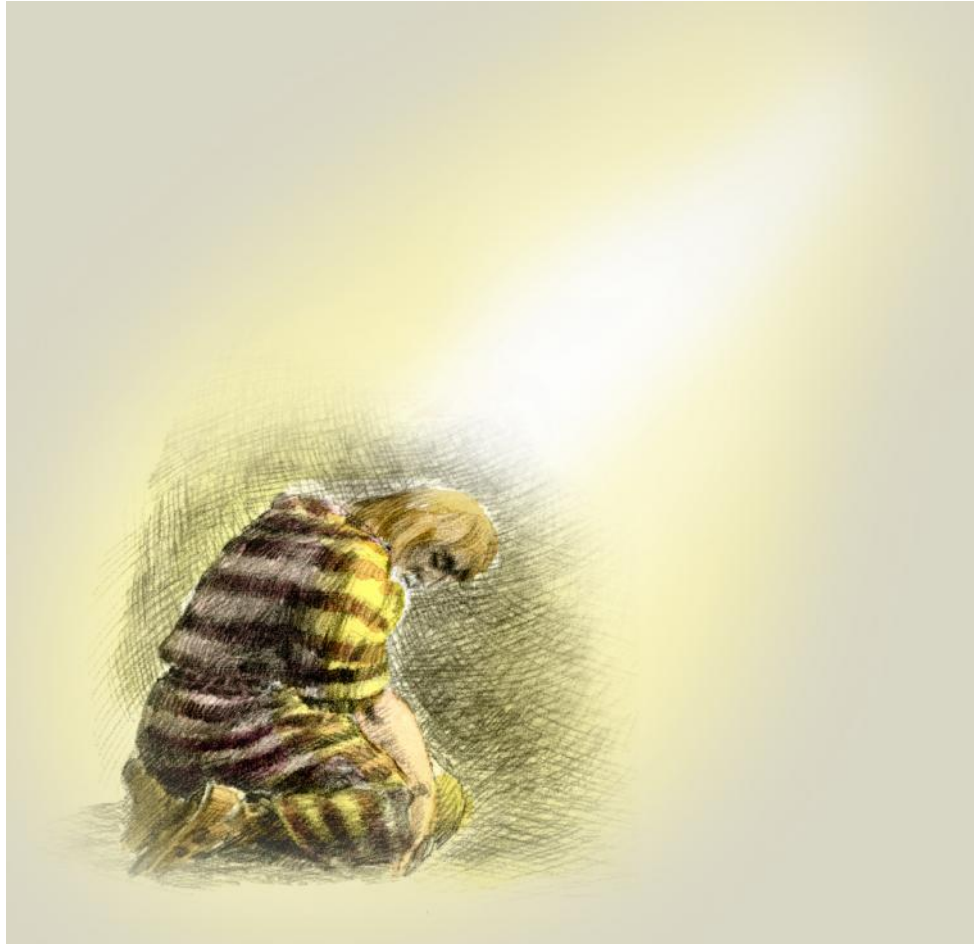
Kuva © taidegraafikko Kimmo Pälikkö