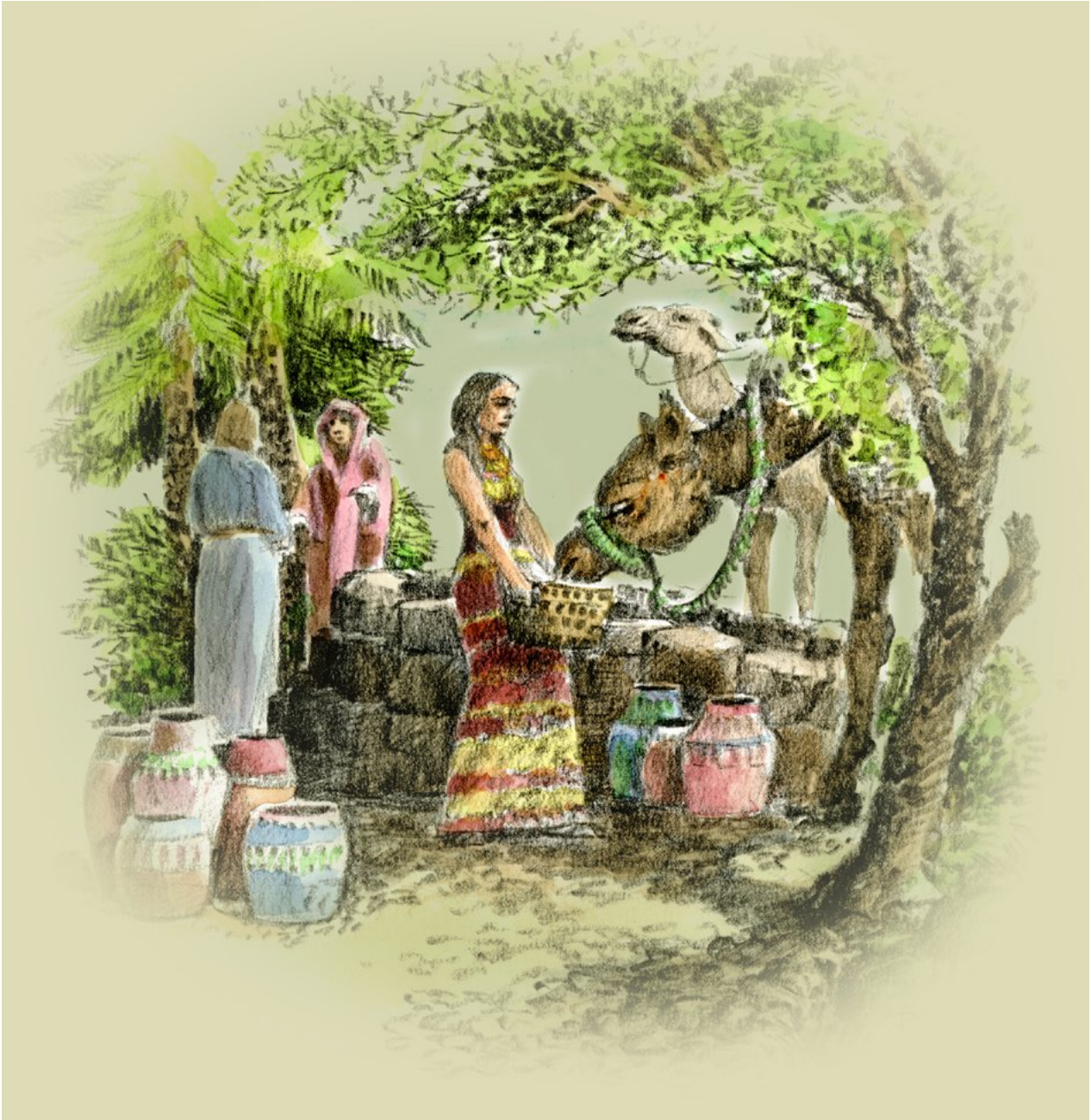
Kuva © taidegraafikko Kimmo Pälkkö