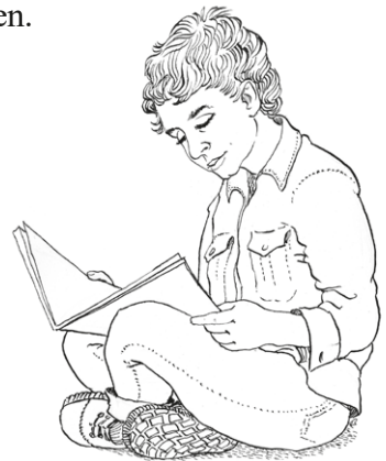
C.F.W. Walther – Kotihartaus

Hyvä Paimeneni, auta minua lukemaan ahkerasti Raamattua, uskomaan sen sana ja seuraamaan sitä. Aamen.