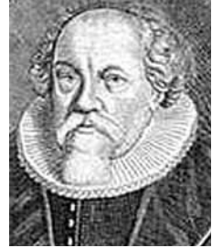
Johannes Gerhard (1582–1637)