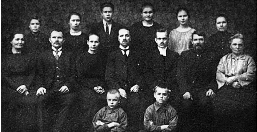
Yllä Turun seurakuntalaisia vuonna 1924