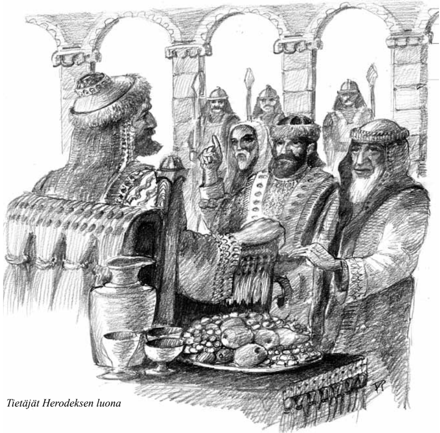
Tietäjät Herodeksen luona

kansa. Hänen uskonsa oli kuitenkin samanlaatuinen kuin paholaisellakin. Saatanakin kyllä pitää kristinuskon totuuksia historiallisina totuuksina, mutta hän tekee kaikkensa vastustaa Jumalaa ja hänen pyhiään. Älkäämme siis olko sellaisia kuin Herodes, vaan historiallisen totena pitämisen lisäksi luottakaamme ja turvautukaamme Jumalan lupauksiin syntien anteeksiantamuksesta. Laitta-kaamme kaikki toivomme Jeesukseen, joka syntyi neitsyestä ja elämällään ja kuolemallaan sai aikaan rauhan Juma-