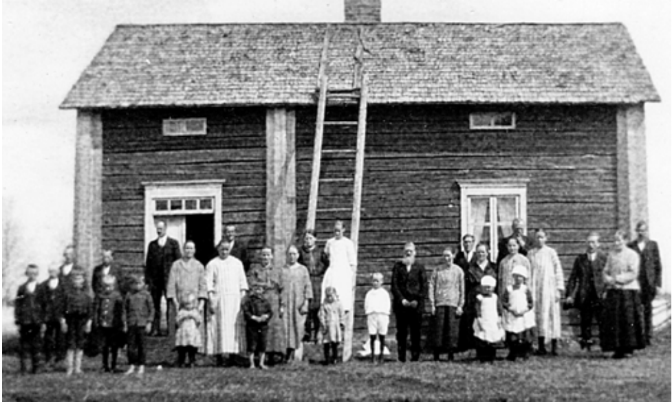
Kuvassa Kyyjärven seurakuntalaisia. Kuva on otettu vuonna 1925 tai 1926. Seurakuntaan kuului vuoden 1926 lopussa 23 aikuista ja 26 lasta. Alla Lahden seurakuntalaisia vuonna 1925