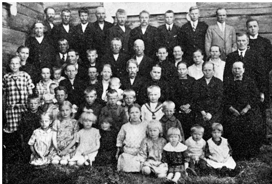
Alla Vuokselan seurakuntalaisia vuonna 1928