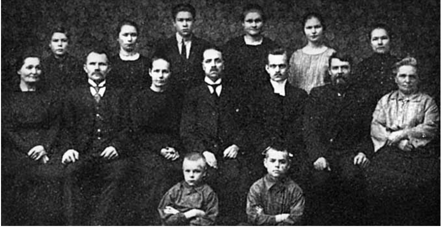
Yllä Turun seurakuntalaisia vuonna 1924