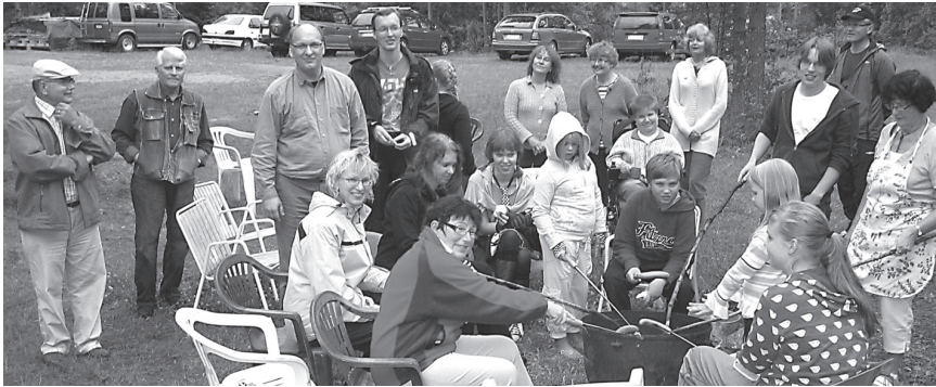
Vanhan leiriperinteen mukaisesti illalla lipunlaskun jälkeen kokoonnuttiin iltanuotiolle laulamaan ja paistamaan pientä syötävää.