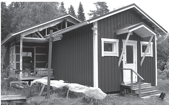
Ukkolan eteen, kirjasto- rakennukseen liitettynä rakennetaan lisäraken- nus, jonka valmistuminen on jo hyvässä vauhdissa.