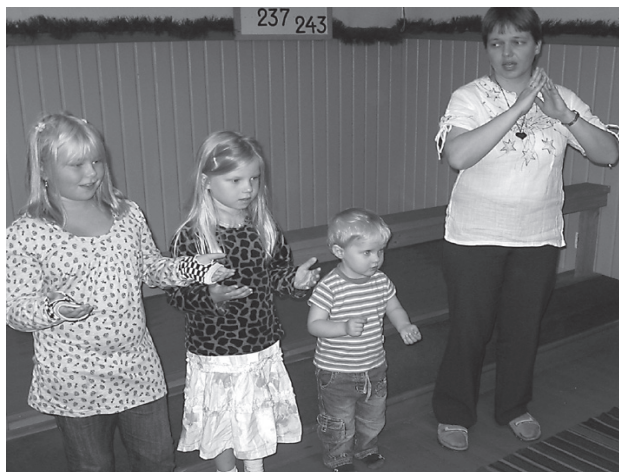
Lapset tervehtivät leiriläisiä päätösjumalanpalveluksessa laulamalla: Viisas mies kalliolle rakensi.